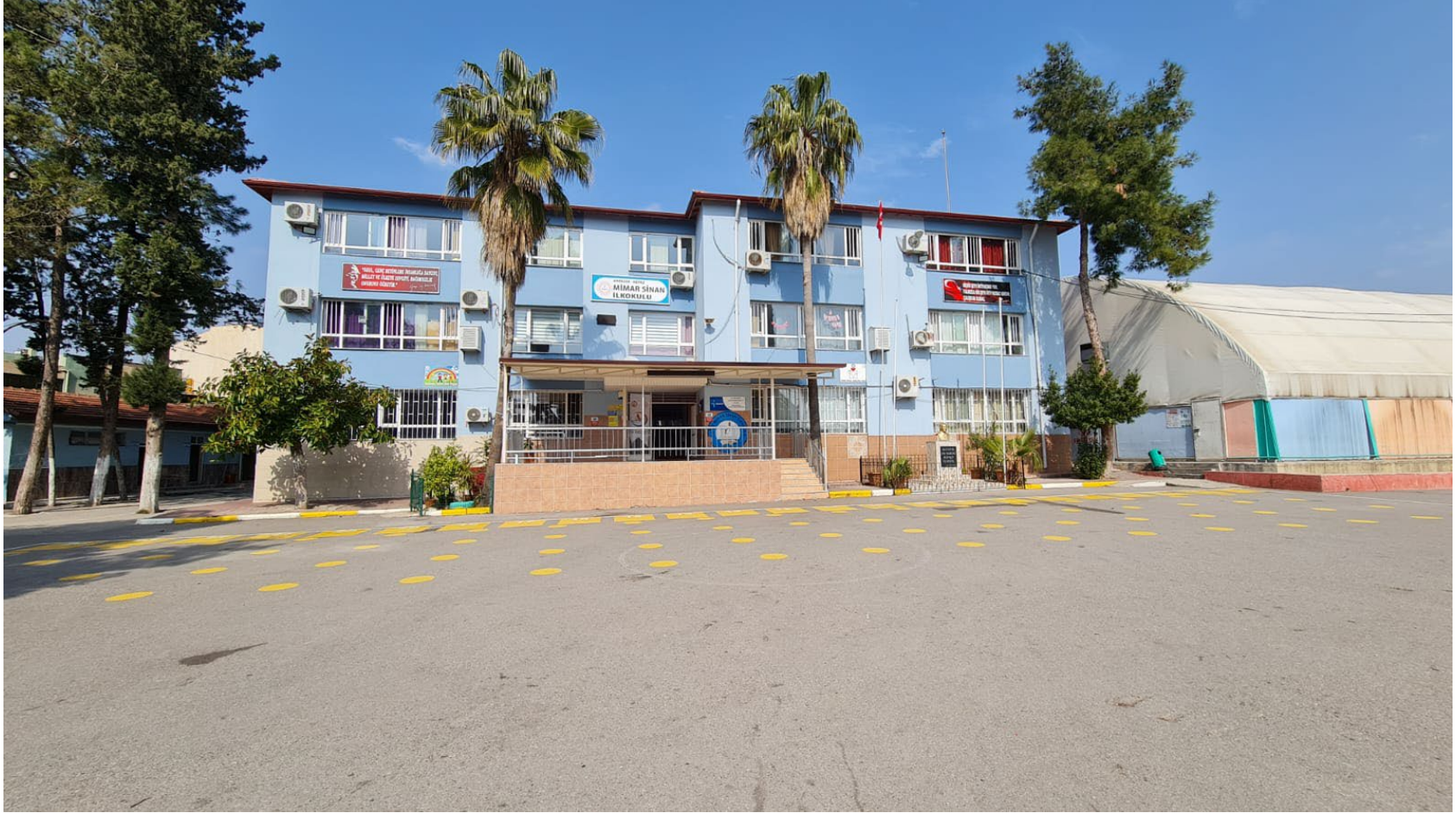
Okulumuzun Dış Görünüşü